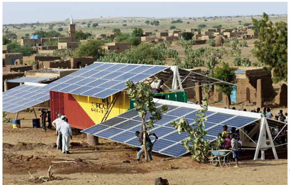
Eine Photovoltaik-Anlage mit Microgrid für ein Dorf in Westafrika. Im Container, dem sogenannten Solartainer, ist auch eine Lithium-Ionen-Batterie, eine Wasseraufbereitungsanlage und eine Wifi-Satelliten-Verbindung integriert.